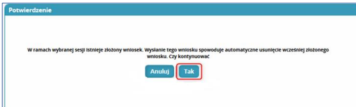
Rysunek 5 Komunikat o usunięciu poprzedniego wniosku

Uwaga: W sytuacji gdy użytkownik już wcześniej złożył wniosek o LEK/LDEK w tej samej sesji egzaminacyjnej, zostanie poinformowany poniższym komunikatem o automatycznym usunięciu wcześniej złożonego wniosku w przypadku dokonania potwierdzenia poniższego komunikatu przyciskiem „Tak”.