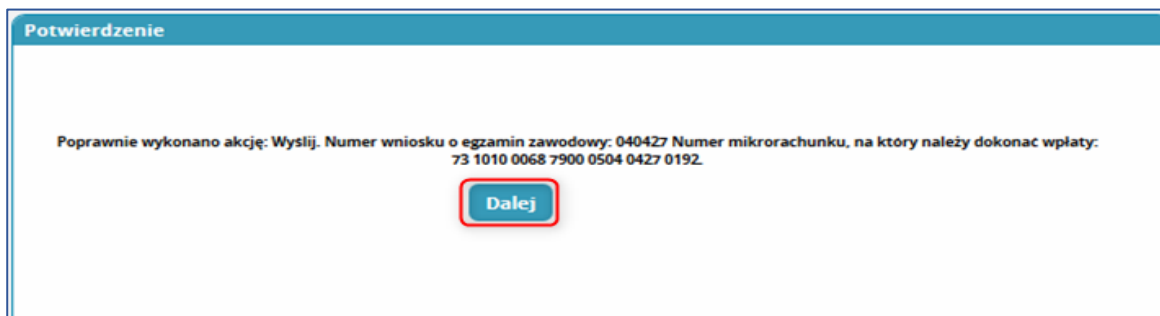
Rysunek 6 Potwierdzenie – wyślij

Informacja zawiera numeru wniosku o egzamin zawodowy oraz numeru mikro rachunku, na który należy dokonać wpłaty, jeżeli dotyczy. Użycie przycisku „Dalej” powoduje wystanie wniosku do Centrum Egzaminów Medycznych oraz przeniesienie informacji o numerze wniosku o egzaminie zawodowym i numerze mikro rachunku na formularz wniosku.