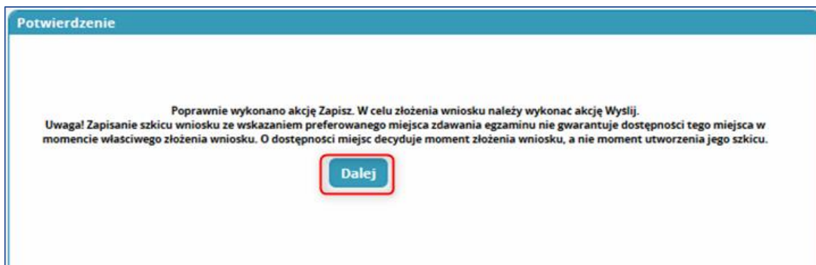
Rysunek 18 Potwierdzenie zapisania wniosku w Systemie

Poprawny zapis wniosku zostanie potwierdzony poniższym komunikatem, stanowiącym o zapisaniu wniosku, a nie o jego wysłaniu. Komunikat informuje również, że wniosek w formie „Szkic” nie gwarantuje dostępności preferowanego miejsca zdawania egzaminu. O dostępności miejsc decyduje moment złożenia wniosku, a nie moment utworzenia jego szkicu.