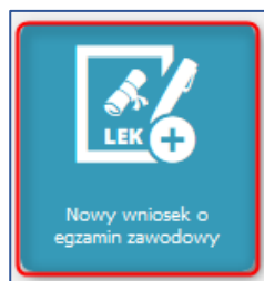
Rysunek 2 Kafelek - Nowy wniosek o egzamin zawodowy

W celu złożenia nowego wniosku o LEK/LDEK, należy wybrać kafelek „Nowy wniosek o egzamin zawodowy”.