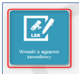
Rysunek 1 Kafelek - Wnioski o egzamin zawodowy

W zależności od roli użytkownika dostępne będą różnego rodzaju funkcjonalności (inne dla roli „Lekarz”/„Lekarz Dentysta”, a inne dla roli „Absolwent”).